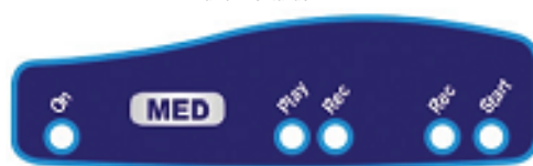
Painel frontal do MED

3.6 - Caso não tenha sido satisfatória a qualidade da gravação, repita a operação, sempre observando o volume da fonte de áudio;