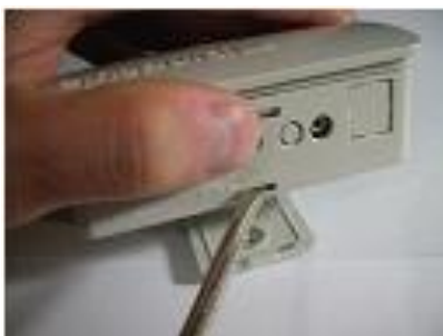
Retirando a base de fixação